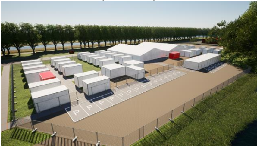
Afbeelding 2: Een 3D –impressie van de tijdelijke noodopvang aan De Nestel in Dongen

De afbeelding is slechts een impressie, hier kunnen nog dingen aan veranderen. Dit laten we u dan weten via www.dongen.nl/opvang '