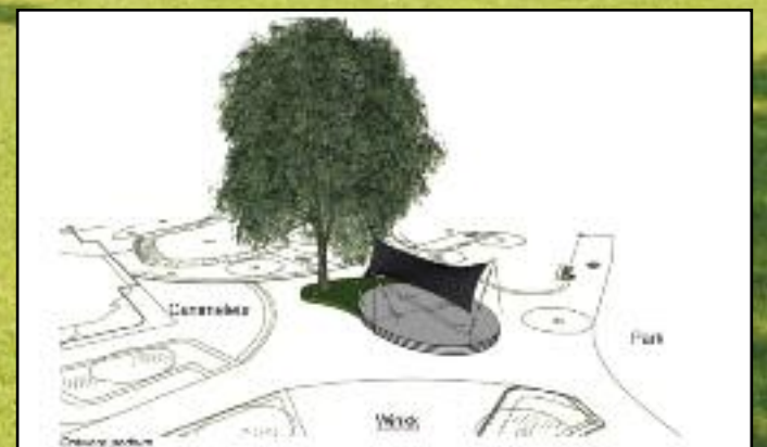
Het parkpodium krijgt een plek achter de terrassen van De Cammeleur en Brasserie Winkk. De aanwezige struiken worden verwijderd.