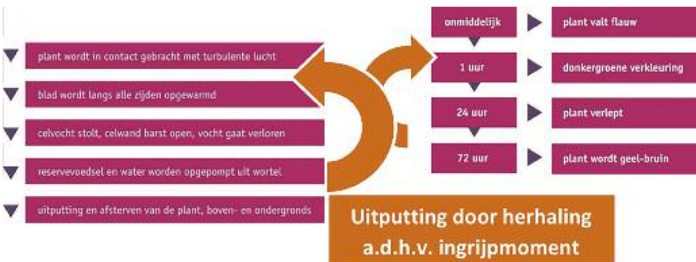
Schematische weergave van Thermische bestrijdingswijze:

Half verharde paden worden 5 keer per jaar behandeld met hete lucht (zoals in de Ecologische Verbindingszone (EVZ), Bieslant en de dijkjes). De wegen worden niet behandeld. Alleen de goten(randen) van de wegen. En uiteraard trottoirs en parkeerplaatsen worden behandeld.