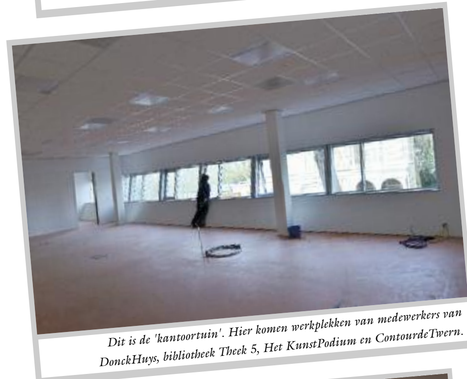
Dit is de 'kantoorruimte'. Hier komen werkplekken van medewerkers van DonckHuys, bibliotheek Theek 5, Het KunstPodium en ContourdeTavern.