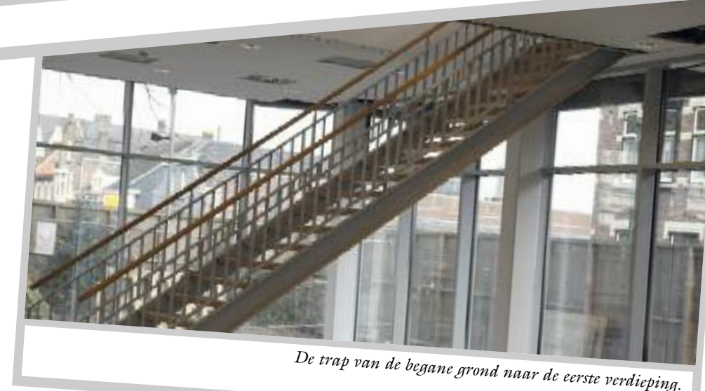
De trap van de begane grond naar de eerste verdieping.