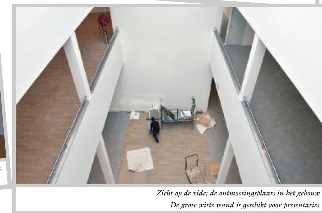
Zicht op de vide; de ontmoetingsplaats in het gebouw. De grote witte wand is geschikt voor presentaties.