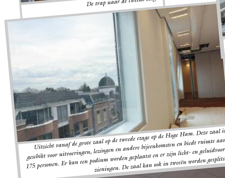
Uitzicht vanaf de grote zaal op de tweede etage op de Hoge Ham. Deze zaal is geschikt voor uitvoeringen, lezingen en andere bijeenkomsten en biedt ruimte aan 175 personen. Er kan een podium worden geplaatst en er zijn licht- en geluidvoorzieningen. De zaal kan ook in tweeën worden gesplitst.