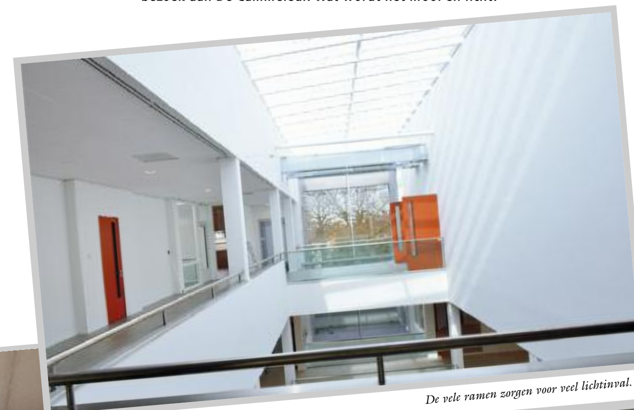
De vele ramen zorgen voor veel lichtinval.