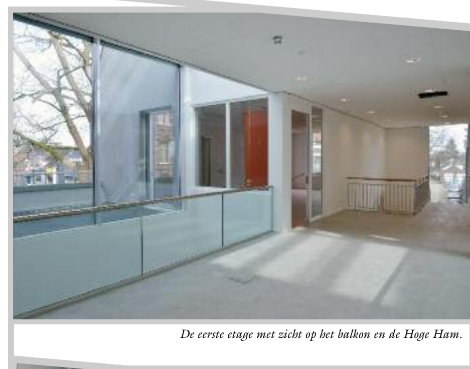
De eerste etage met zicht op het balkon en de Hoge Ham.