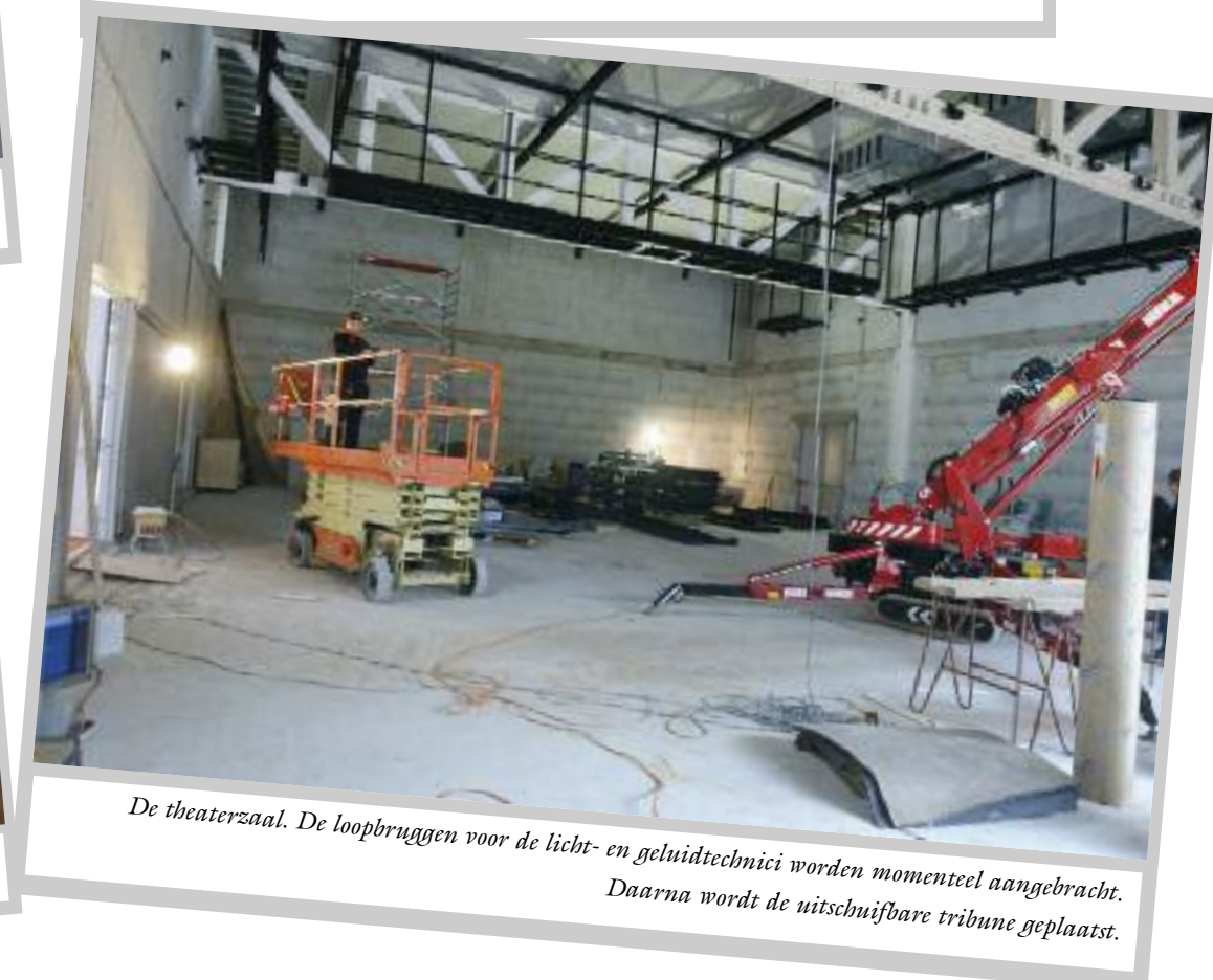
De theaterzaal. De loopbruggen voor de licht- en geluidstechnici worden momenteel aangebracht. Daarna wordt de uitschuifbare tribune geplaatst.