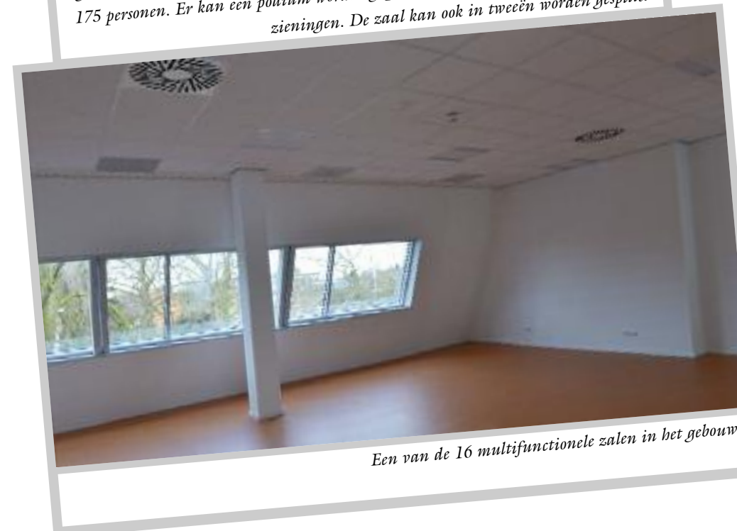
Een van de 16 multifunctionele zalen in het gebouw.