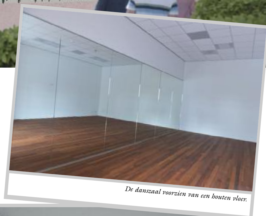
De danszaal voorzien van een houten vloer.