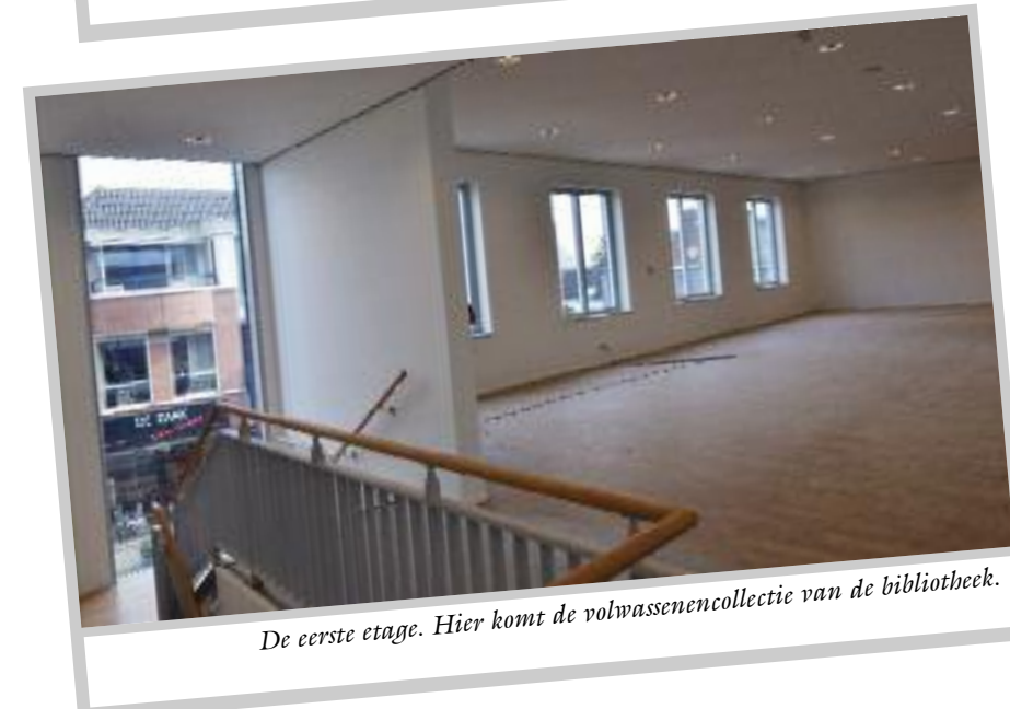
De eerste etage. Hier komt de volwassenencollectie van de bibliotheek.