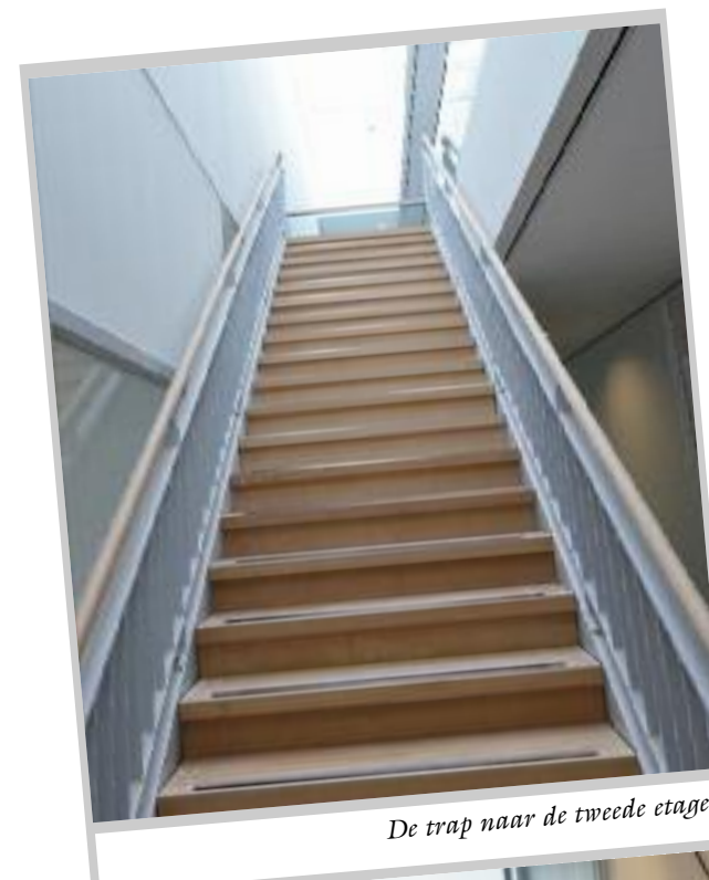
De trap naar de tweede etage.