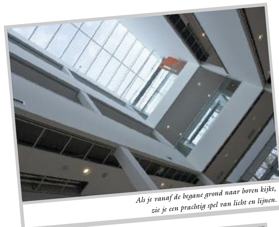
Als je vanaf de begane grond naar boven kijkt, zie je een prachtig spel van licht en lijnen.