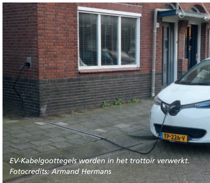
EV-Kabelgoottegels worden in het trottoir verwerkt.

Het afgelopen jaar heeft de gemeente Dongen een pilot gehouden met het gebruik van kabelgoottegels voor elektrische voertuigen. Door de EV-kabelgoottegel te gebruiken ligt de laadkabel van een elektrisch voertuig niet op het trottoir, maar in de tegel. Dit voorkomt onveilige situaties en een voertuig kan vanaf particulier terrein toch worden opgeladen in de openbare ruimte. De kabelgoottegel is een idee van Dongenaar Armand Hermans. De tegel wordt de EV-kabelgoottegel genoemd. EV staat voor Elektrisch Voertuig.