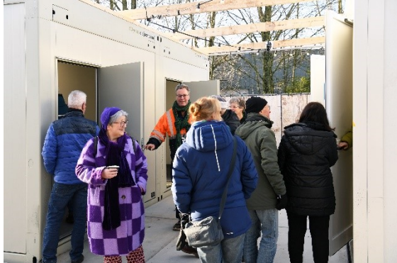
Bezoekers tijdens de Open ochtend op 27 januari 2024

De eerste asielzoekers zijn donderdag 1 februari 2024 aangekomen in de tijdelijke noodopvang in Dongen. Het Rode Kruis ontvangt iedereen op de locatie en vanuit de gemeente krijgen ze een welkomstpakket. Ruim 20 Dongenaren hebben zich gemeld om vrijwilligerswerk te doen. Daarnaast bieden sportverenigingen Atledo en DVVC mogelijkheden aan voor invulling van recreatie en dagbesteding. Dit alles zorgt voor een fijn welkom in Dongen.