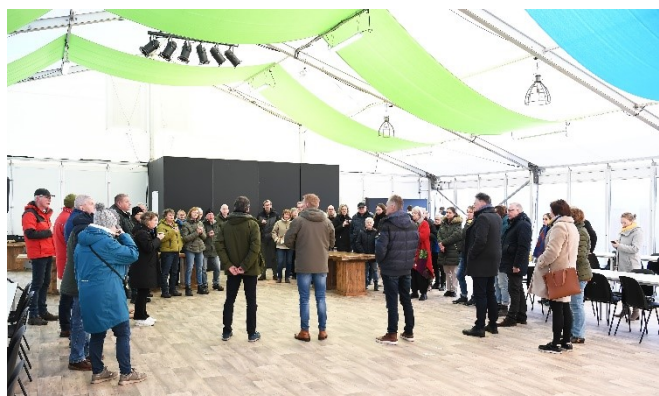
Bezoekers tijdens de Open ochtend op 27 januari 2024

De open ochtend werd bezocht door 320 mensen. Tijdens de open ochtend hebben ook meer vrijwilligers zich gemeld die op wat voor manier dan ook willen helpen.